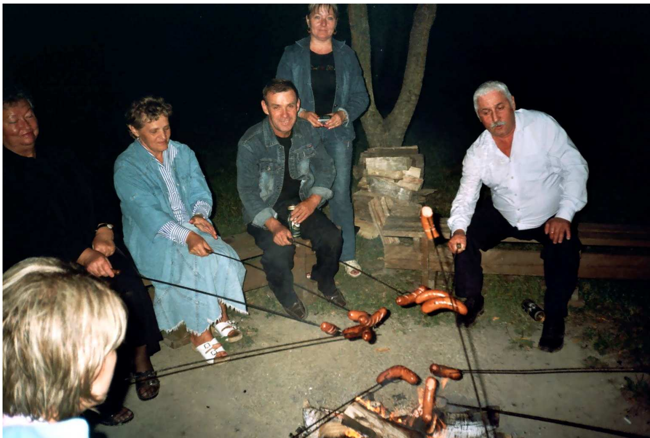
... i wieczorne ognisko.