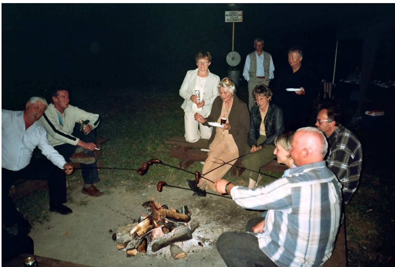
Dziękujemy DOKTORZE !!!